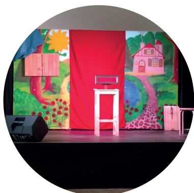
Petit Tom et L'Arc en Ciel Magique