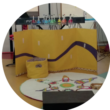
Les Clochettes de Noël