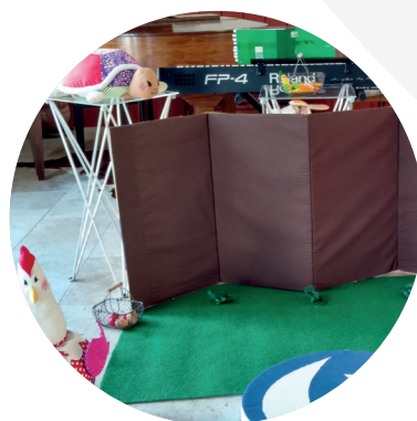
À ma Campagne !