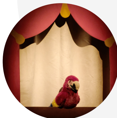
Le Conte de Lucia